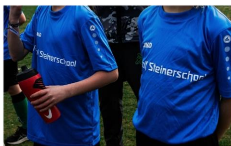
Pinksterfeest op vrijdag 17 mei.

Ook hebben we mooie sporttenues kunnen aanschaffen met ons logo erop. Deze worden o.a. gebruikt voor het Schoolvoetbaltoernooi dat afgelopen dinsdag van start is gegaan. Met maar liefst 3 teams zijn we dit jaar vertegenwoordigd.